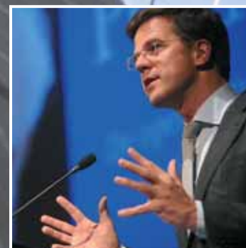
De verkleinde schoenmaat van Mark Rutte