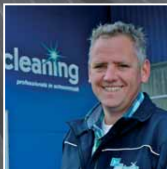
Uitblinken in heldere oplossingen