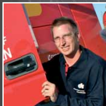
Goed personeel vinden lastig? Kijk eens bij WVS-groep