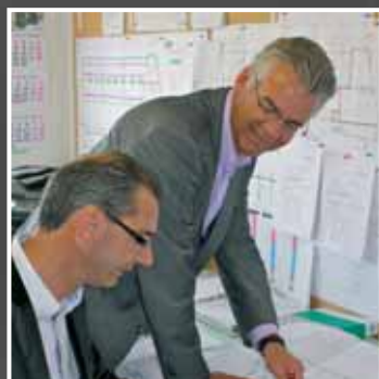
Laat je inspireren door Business Center Borchwerf2